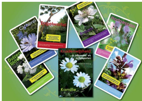
Kruidenworkshop 11 april 19.30 – 22.00 door kruidenexpert Marjanne Husing

Uiteraard heeft het gebouw waar de praktijk gevestigd is een toilet maar wie wel eens bij mij is geweest voor een massage, weet dat het toilet wel een stukje lopen is. Vandaar dat ik een 'nood toilet' heb aangeschaft die in een afgesloten ruimte direct naast mijn kamer staat. Geheel privé en wel zo prettig dat je niet weer in de kleren hoeft te schieten! Ook nieuw is de Body Cushion, hierboven op de foto. Een set kussens die op verschillende manieren gebruikt kan worden. Vooral voor zwangere vrouwen en mensen die moeilijke plat kunnen liggen in verband met rugklachten, bieden de kussens een uitkomst. Wil je meer over de behandelingen of over vergoedingen weten, kijk dan even op de website: www.astridnieborg.nl